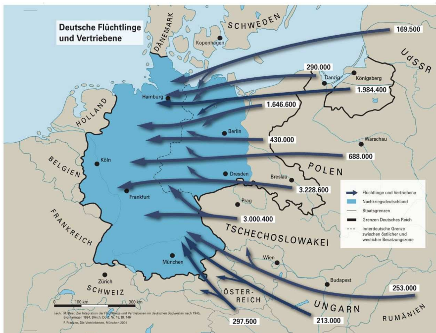
Übersicht der Flüchtlinge und Vertriebenen, die nach Kriegsende in den Westen flüchteten.

Tatsächlich war Schweinfurt aufgrund der Kugellagerfabriken, die fast die Hälfte der deutschen Wälzlagerherstellung ausmachten, ein sehr wichtiges strategisches Ziel für die Alliierten und wurde somit Opfer schwerer Luftangriffe. Nach Ende des Zweiten Weltkrieges hatte Schweinfurt jedoch nicht nur mit dem Problem zu kämpfen, dass die Stadt zu einem großen Teil zerstört war. Weitere Notstände, wie die Hungersnot der Bevölkerung und die fehlende Versorgungsmöglichkeit der vielen Flüchtlinge, die in Schweinfurt Zuflucht suchten, mussten bewältigt werden. Denn aufgrund der gewaltsamen Vertreibung hunderttausender Menschen aus den alten Ostgebieten Deutschlands durch die Rote Armee, flohen viele Menschen in den Westen Deutschlands, unter anderem auch nach Schweinfurt. Aloisia Müller prägten die Bilder der Flüchtlingswelle besonders, wie im Gespräch deutlich wird: „Dann war die Flüchteezeit und dann waren die Züge - das Bild vergesse ich nie in meinem Leben - zugestellt mit Menschen. Die Züge waren so voll von Menschen, von außen hat man nichts mehr gesehen, sie waren an der Tür gehangen und an den Trittbrettern und am Fenster“.