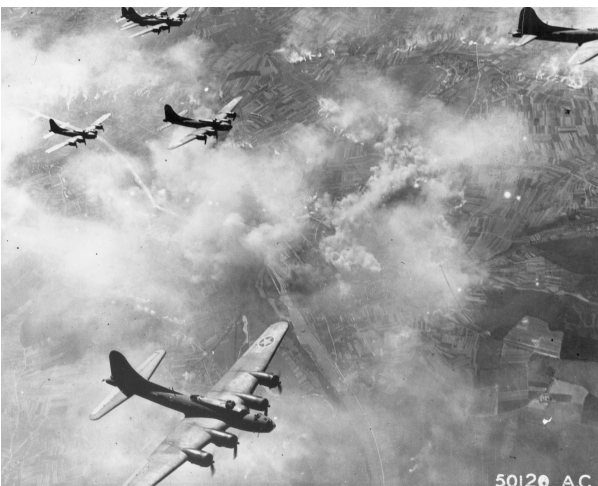
US Air Force Angriff am 17. August 1943 auf die deutsche Kugellager-Industrie in Schweinfurt