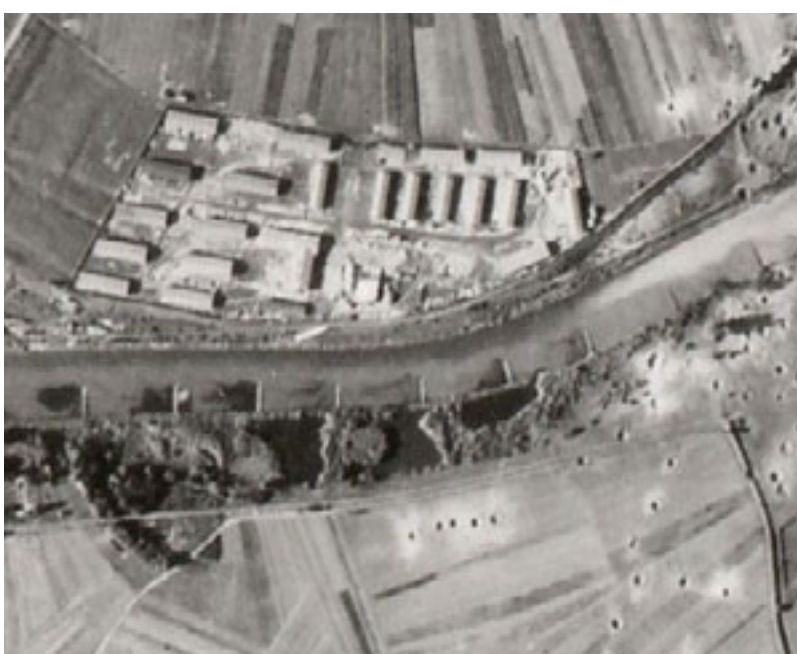
Das Zwangsarbeiterlager »Mittlere Weiden« von Kugelfischer auf einem Luftbild der US-Armee vom 9. April 1944

Sie arbeiteten in allen großen Betrieben, auch in Gärtnereien, Kfz-Werkstätten, Kohlenhandlungen und sogar in Privathaushalten. Auch die Stadt Schweinfurt hatte für Arbeiten im Wasserwerk, als Hausmeister, bei der Müllabfuhr, den Gartenbetrieben, im Gaswerk, usw. mehrere hundert Zwangsarbeiter, für die auf der Maininsel ein Lager errichtet wurde.