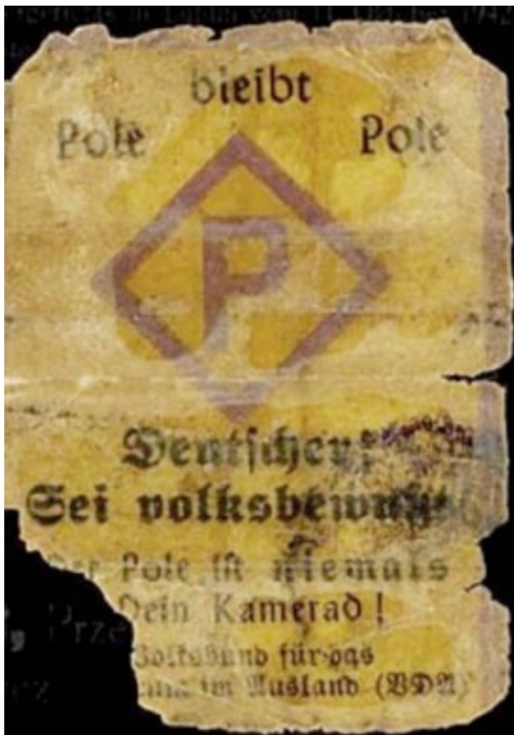
Warnung vor „dem Polen“ mit dem Zeichen, das die polnischen Zwangsarbeiter auf der Kleidung tragen mussten.

Die Initiative gegen das Vergessen hat es sich zur Aufgabe gemacht, daran als Teil der Heimatgeschichte immer wieder zu erinnern.