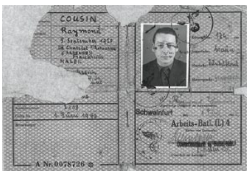
Ausweis eines französischen Zwangsarbeiters

»Hunger und Kälte – wir waren nur ein Schatten unserer selbst.«