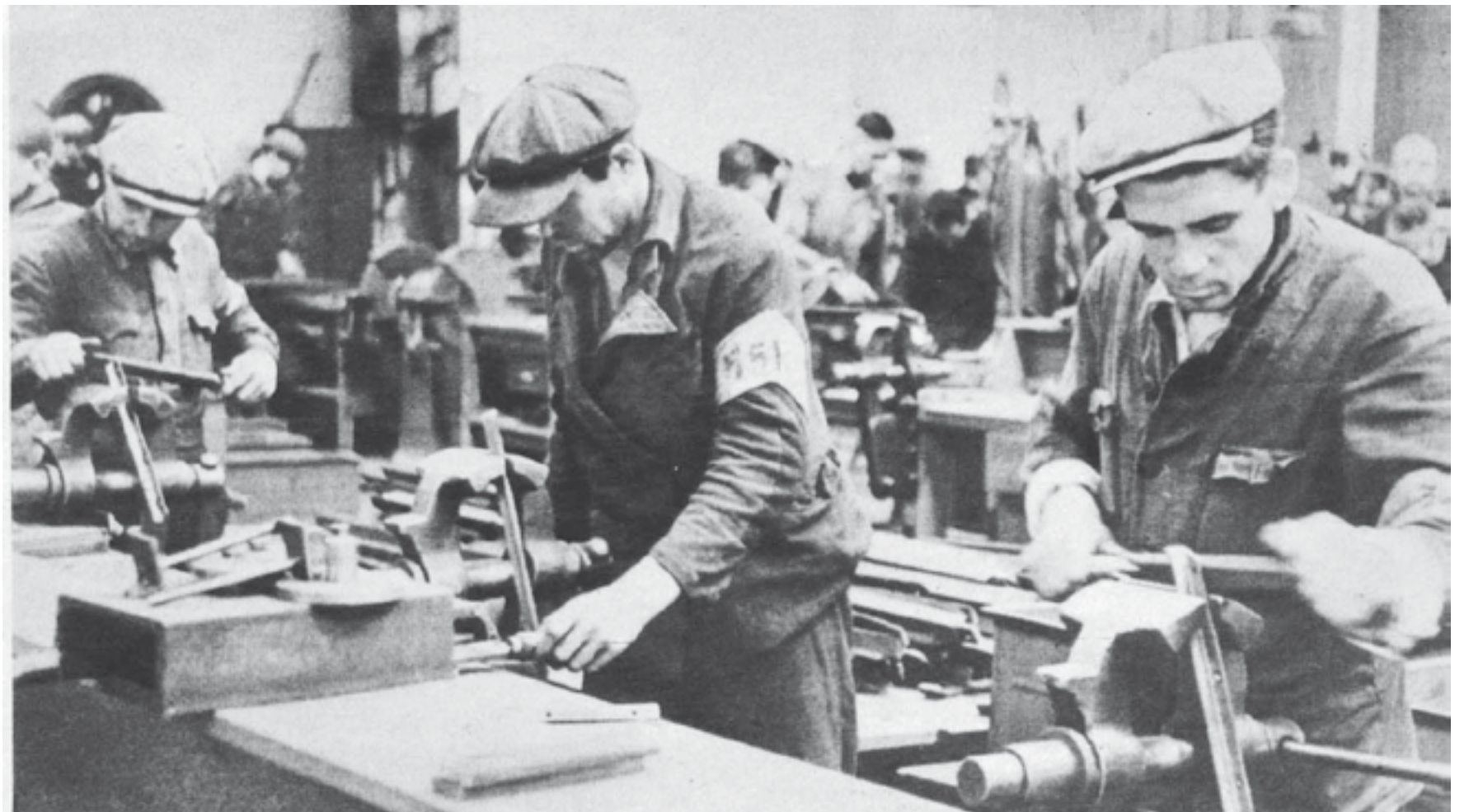
»Der Arbeitstag dauerte zwölf Stunden von 6.00 Uhr am Morgen bis 6.00 Uhr am Abend.«

Auf dem ehemaligen Lagergelände von Kugelfischer „Mittlere Weiden“ entstand der Gedenkort „Drei Linden“ durch den Künstler hermann de vries.