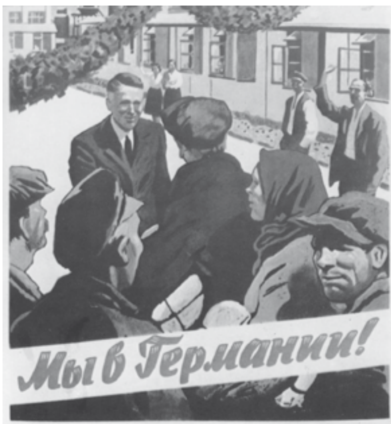
Propagandaplakat zur „Anwerbung“ von Arbeitskräften.

Sie kamen aus vielen Ländern, einige zuerst angeworben, später alle mit Gewalt verschleppt.