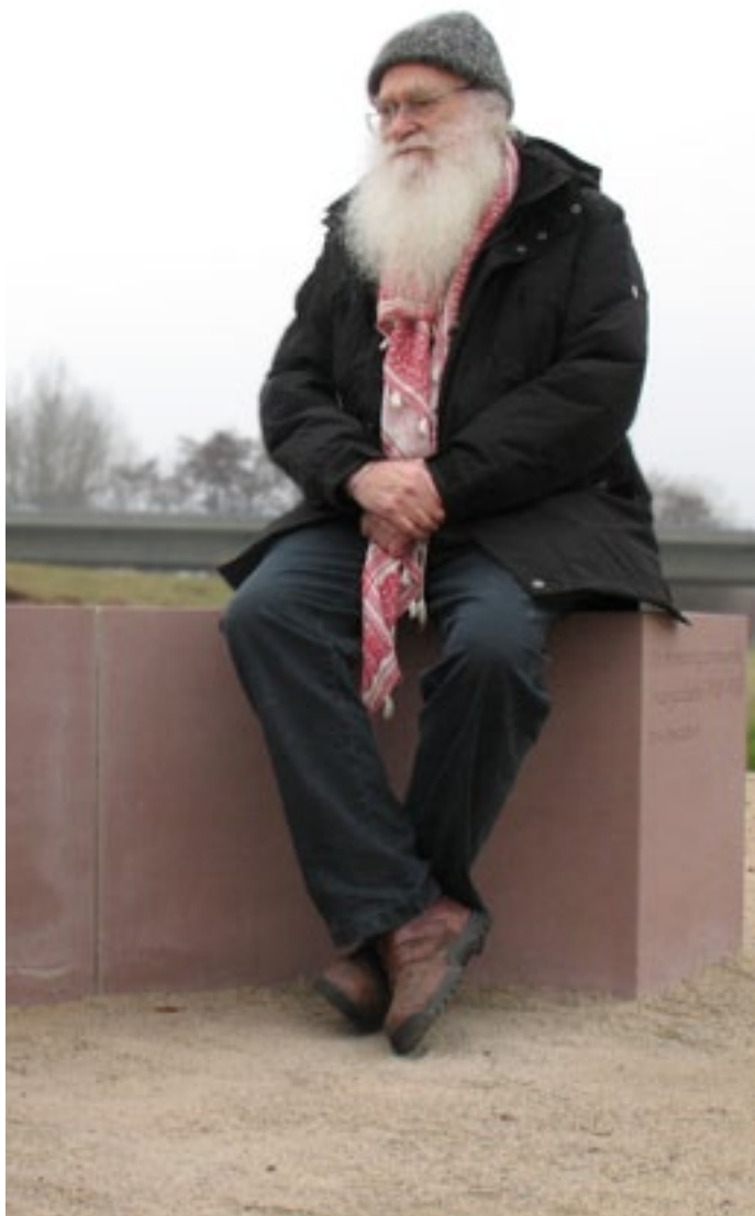
Der Künstler herman de vries auf der von ihm entworfenen Steinbank.

Auf dem ehemaligen Lagergelände von Kugelfischer „Mittlere Weiden“ entstand der Gedenkort „Drei Linden“ durch den Künstler hermann de vries.